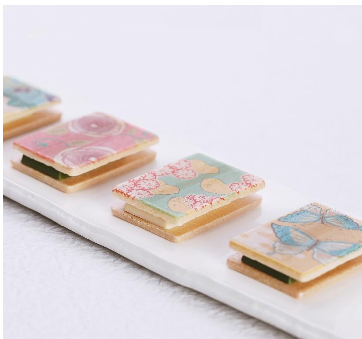
心よせ 結 イメージ