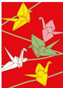
鶴 < 夫婦円満の象徴 >