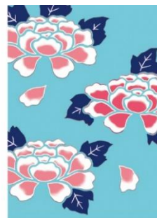
牡丹 < 幸福・不老長寿 >