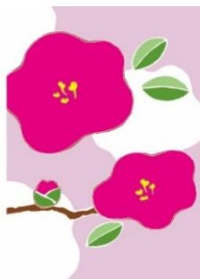
椿 < 控えめな愛 >