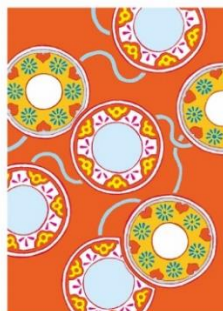
鼓 < 実がなる >