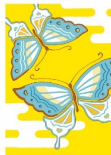
蝶 < 仲睦まじく >