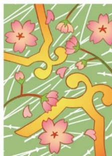
桜と琴柱 < 精神の美 >