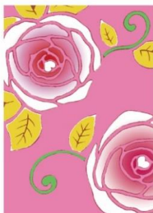
ばら < 愛情のプレゼント >