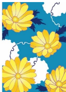
福寿草 < 幸せを招く >