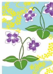
すみれ < 誠実・小さな幸せ >